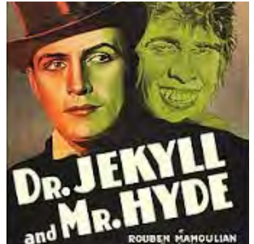
〈지킬 박사와 하이드〉